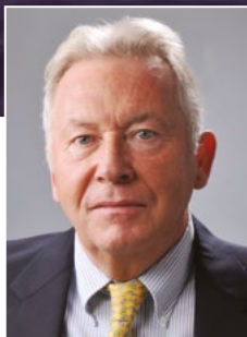
του Γιάννη Μπασιά , Προέδρου και Διευθύνοντα Συμβούλου Ελληνικής Διαχειριστικής Εταιρείας Υδρογονανθράκων (ΕΔΕΥ)

Αποστολή της ΕΔΕΥ είναι η διαχείριση των αποκλειστικών δικαιωμάτων του Δημοσίου στην αναζήτηση, έρευνα και εκμετάλλευση υδρογονανθράκων.